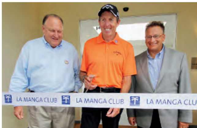
Kam zur Eröffnung nach La Manga gereist: David Leadbetter (M.)