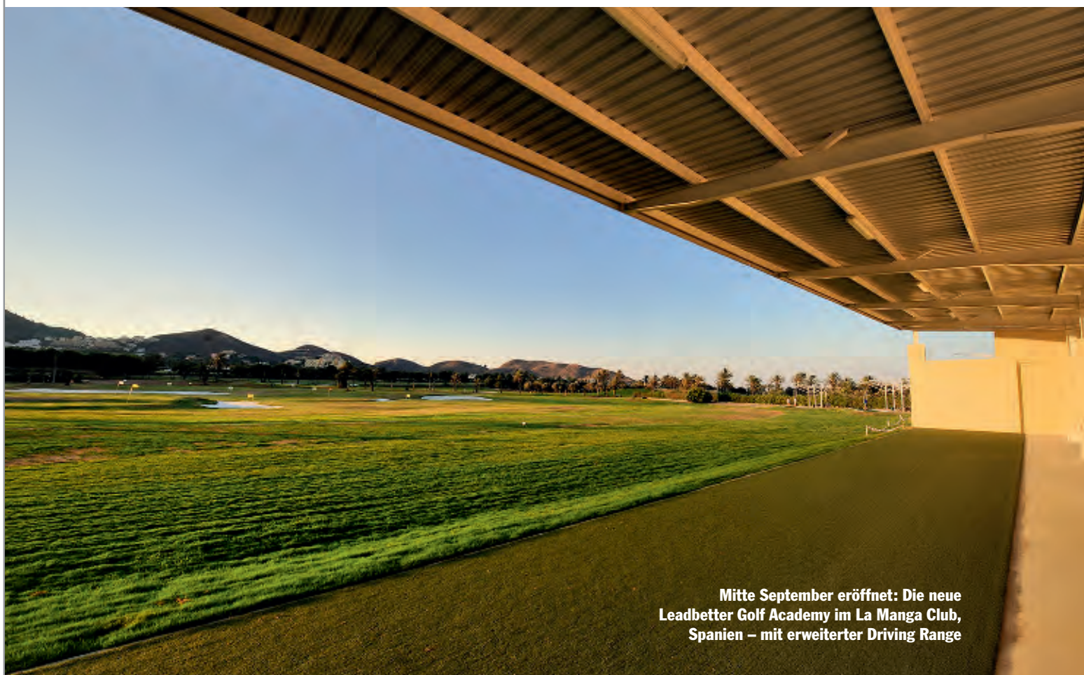
Mitte September eröffnet: Die neue Leadbetter Golf Academy im La Manga Club, Spanien – mit erweiterter Driving Range